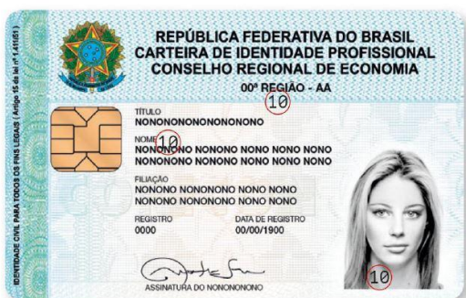
Frente - Sugestão de Personalização