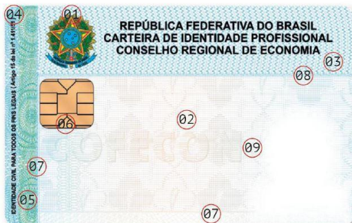
Frente - Sem Personalização