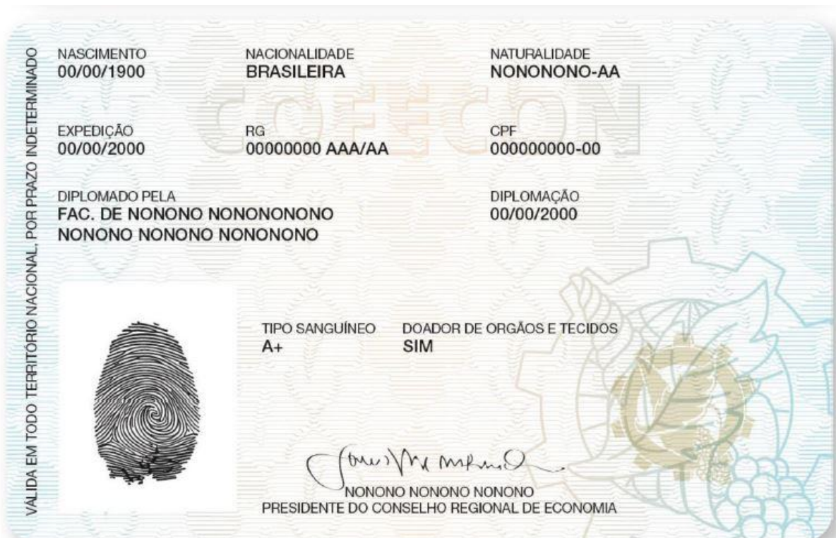
IMAGEM SEM ESCALA