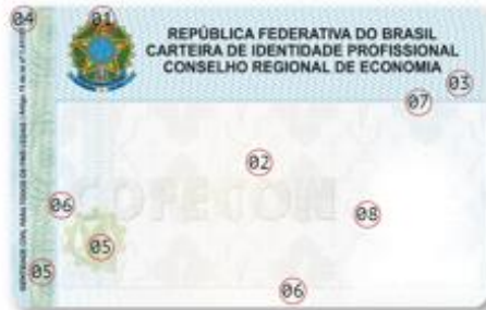
Frente - Sem Personalização