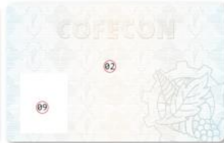
Verso - Sem Personalização