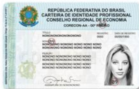
Frente - Sugestão de Personalização